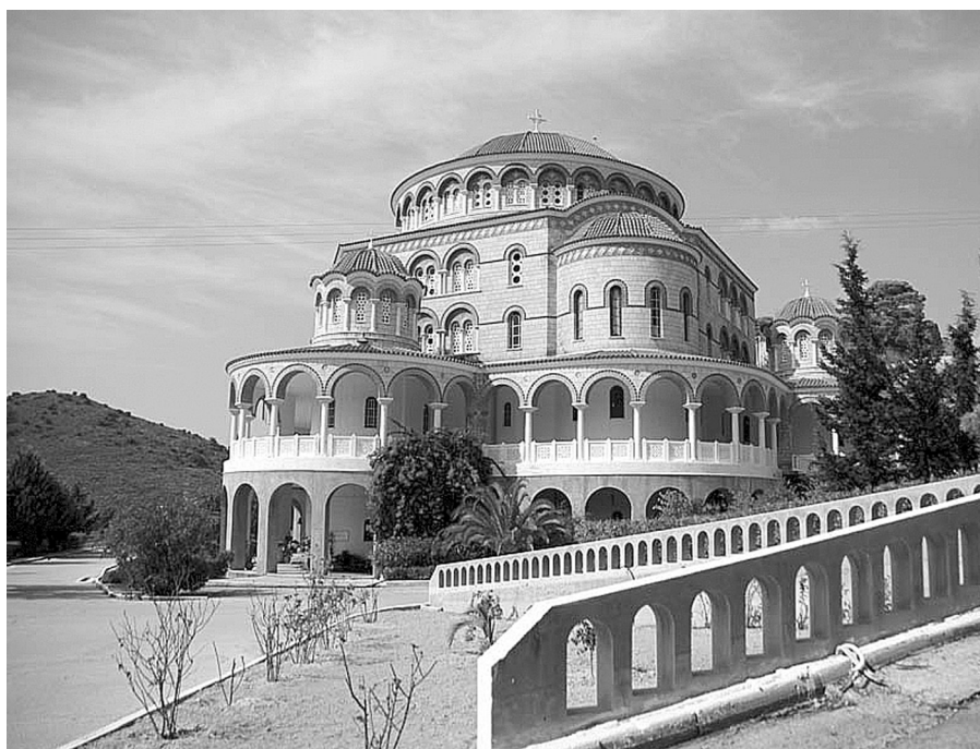
Свято-Троицкий монастырь на о. Эгина

тщетно пытаюсь получить место служения и не имея средств к пропитанию. Мэр города, сжалившись над бедствующим священнослужителем, добился для него места проповедника в провинции Эвбея, а в 1894 году митрополит Нектарий был назначен директором Афинской богословской школы братьев Ризари. Всё это время святитель находился в непонятном каноническом положении и был вынужден подписывать свои бумаги как «путешествующий епископ». В 1904 году владыка Нектарий приобрел на собственные средства участок земли на острове Эгина и основал там Свято-Троицкий женский монастырь. Первыми насельницами в нем стали его ученицы, которых он продолжал поддерживать материально и духовно. Уйдя, по возрасту и состоянию здоровья, с поста директора богословской школы, он поселился на Эгине. 9 (22) ноября 1920 года, в больнице «Аретэо», окончилась его земная жизнь. Его тело после кончины заморозило и долгое время оставалось нетленным. В 1961 году синодальным указом Константинопольской Патриархии святитель Нектарий, митрополит Пентапольский, был причислен к лику святых, а в 1998 году Священный Синод Александрийской Православной Церкви вынес решение о его полной церковной реабилитации.