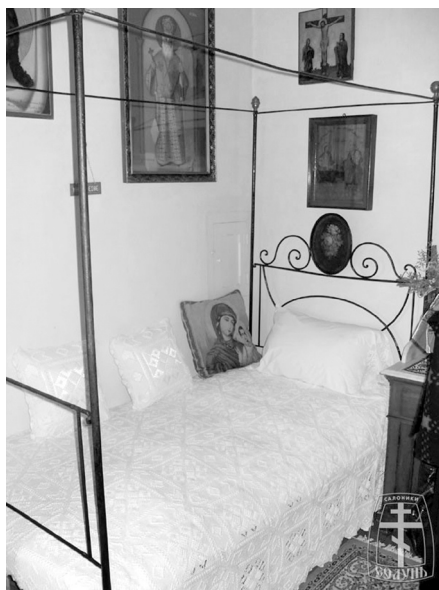
Келья святителя Нектария

Один мой хороший друг, сейчас тоже игумен, рассказал мне как-то о своей знакомой, певчей московского храма. У нее был рак